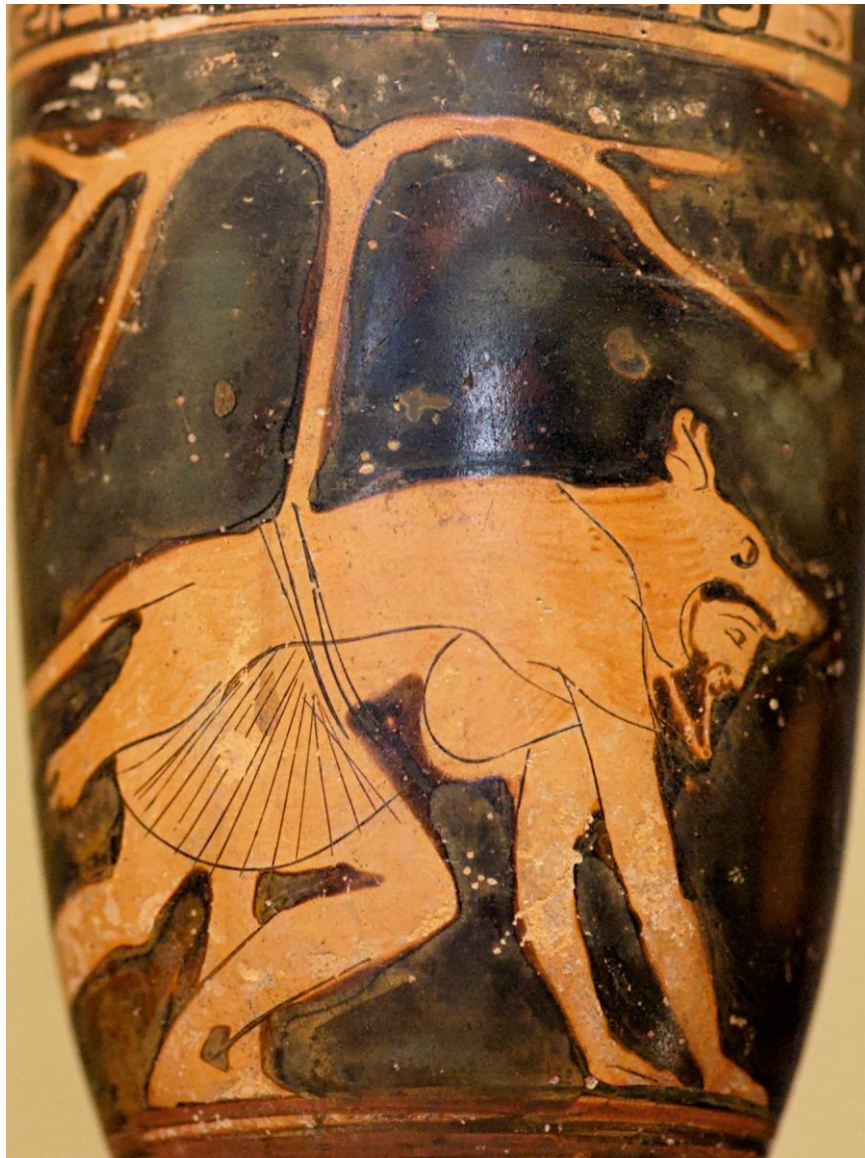
LIMC Dolon 2